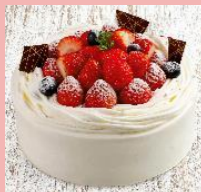
生クリーム デコレーション 4号～7号