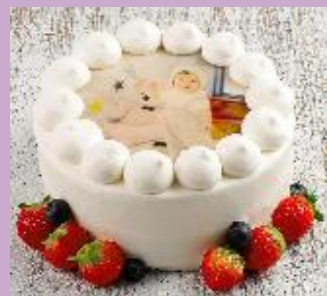
オリジナルプリントデコレーション 【5日前までのご予約】