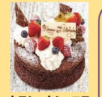
クラシックショコラ