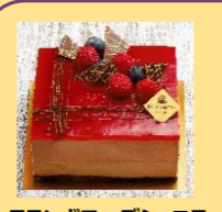
フランボワーズショコラ