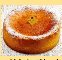
バイクチーズケーキ