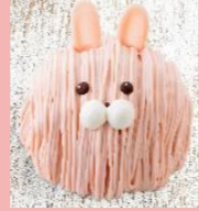
苺のうさぎ 4号・5号