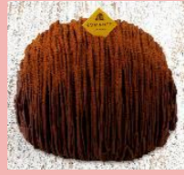
チョコモンブランドーム 4号・5号