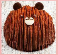
くまチョコモンブラン 4号・5号