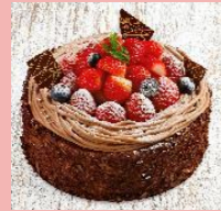
チョコ生クリーム デコレーション 4号～7号